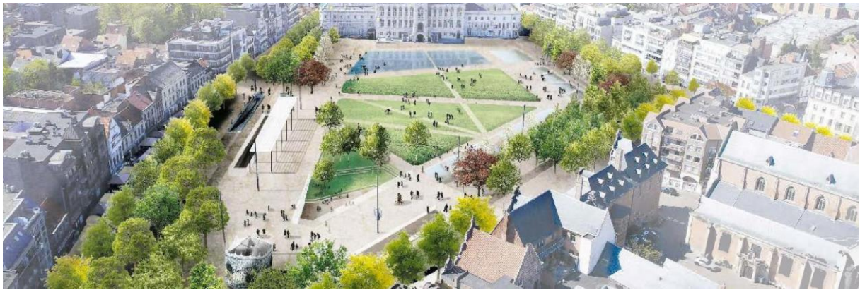
Plannen Markt Sint-Niklaas Raadslid Wouter Bouckaert

Het is wat symptomatisch dat als het gaat over grotere (infrastructuur)projecten, bijv. de zogenaamde cultuurtempel, de zogenaamde sporttempel dat er deze legislatuur nog maar heel weinig tot geen beslissingen werden genomen. Dit kan er een zijn en het zou jullie sieren als stadsbestuur om dit ook te durven beslissen, in het belang van onze stad.