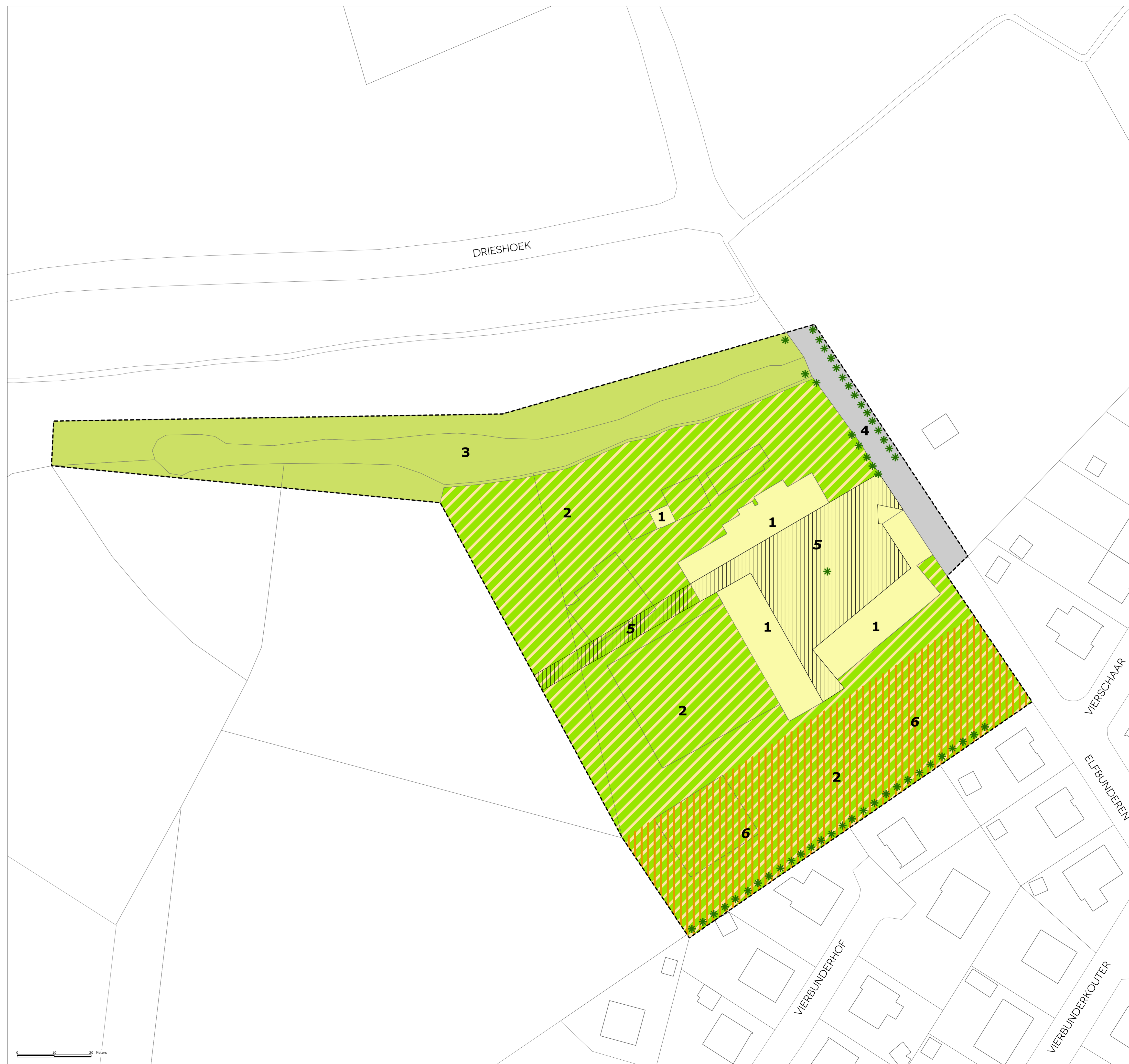
LIGGINGSPLAN SCHAAL 1:25.000