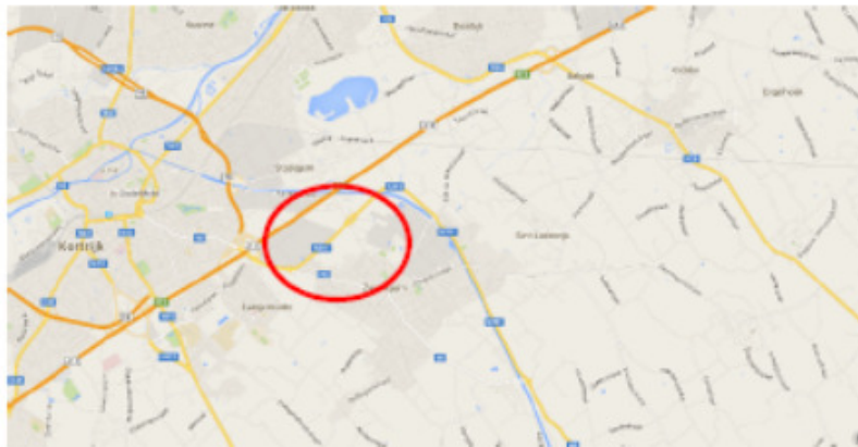
Figuur 1 : situering projectgebied op macroniveau.

Voorliggende nota is de startnota die opgemaakt wordt voor de realisatie van de ontsluiting van het bedrijventerrein "De Losschaert" te Zwevegem. De ontsluiting van dit bedrijventerrein kan niet los gezien worden van het bedrijventerrein "Evolis", gelegen aan noordzijde van de N391.