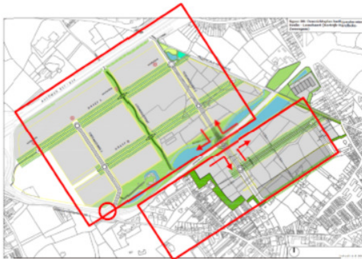
Figuur 27 : variant 1 : Rechtsin-rechtsuit